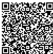
ตัวอย่างหนังสือร้องเรียน

ทั้งนี้ กรณีที่ผู้กล่าวหาไม่เปิดเผย ชื่อ - นามสกุล หรือพฤติการณ์หรือพยานหลักฐานไม่ปรากฏชัดเจน จะถือว่าเป็นบัตรสนเท่ห์ สำนักงาน ป.ป.ท. อาจไม่รับดำเนินการให้ได้