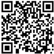
แผนปฏิบัติการฯ ปี ๒๕๖๘

๓.๒ สปท. ป.ป.ท. มีมติเห็นชอบและอนุมัติจัดทำแผนปฏิบัติการขับเคลื่อนกลไกส่งเสริม และสนับสนุน ให้ภาคประชาสังคมรวมตัวกันเพื่อมีส่วนร่วมในการป้องกันการทุจริต ประจำปีงบประมาณ พ.ศ. ๒๕๖๘ และ แผนปฏิบัติการขับเคลื่อนกลไกส่งเสริม และสนับสนุนให้ภาคประชาสังคมรวมตัวกันเพื่อมีส่วนร่วมในการป้องกันการทุจริต ระยะ ๕ ปี ( พ.ศ.๒๕๖๖ - ๒๕๗๐)