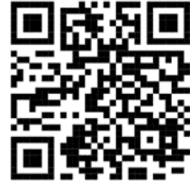
แผนปฏิบัติการฯ ๕ ปี (พ.ศ.๒๕๖๖ - ๒๕๗๐)

๓.๓ คณะกรรมการป้องกันและปราบปรามการทุจริตในภาครัฐได้มีคำสั่งที่ ๔๖๙/๒๕๖๗ ลงวันที่ ๑๓ พฤศจิกายน ๒๕๖๗ เรื่อง แต่งตั้งคณะอนุกรรมการปรับปรุงหลักเกณฑ์การสมัครและคัดเลือกเครือข่ายพื้นที่สีขาว ต้นแบบในการป้องกันและเฝ้าระวังการทุจริต เพื่อพิจารณาปรับปรุงหลักเกณฑ์การสมัครและคัดเลือกเครือข่าย พื้นที่สีขาวต้นแบบในการป้องกันและเฝ้าระวังการทุจริต ของสำนักงาน ป.ป.ท. และนำเสนอหลักเกณฑ์การสมัคร และคัดเลือกเครือข่ายพื้นที่สีขาวฯ เสนอต่อเลขาธิการคณะกรรมการ ป.ป.ท. เพื่อพิจารณาให้ความเห็นชอบ และจัดทำประกาศหลักเกณฑ์ฯ และกำหนดระยะเวลาการรับสมัครคัดเลือก