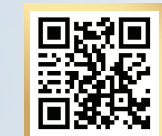
แบบร้องเรียน

ทั้งนี้ หากกรณีใดมีลักษณะส่อไปในทางทุจริตในภาครัฐ ให้คณะกรรมการ ป.ป.ท. รายงานให้คณะรัฐมนตรี และคณะกรรมการ ป.ป.ช. ทราบ เพื่อดำเนินการ ตามอำนาจหน้าที่ต่อไป