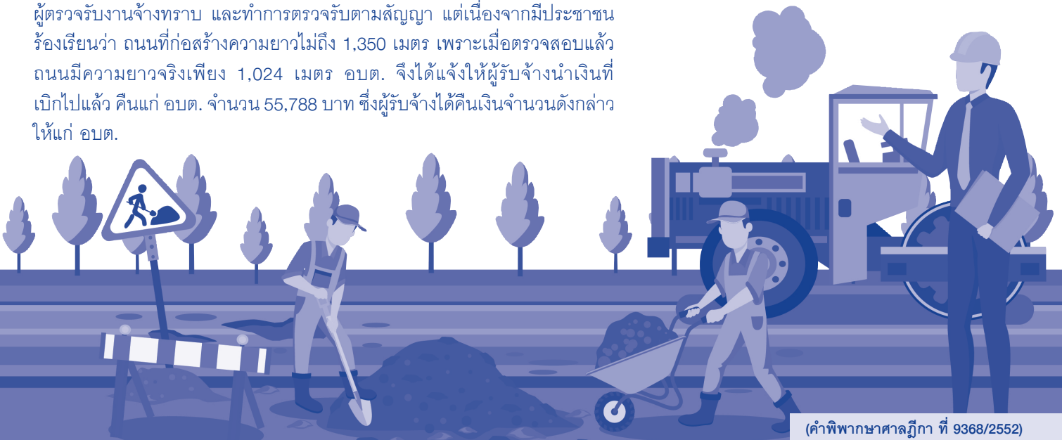
(คำพิพากษาศาลฎีกา ที่ 9368/2552)

ต่อมาโจทก์ คือ อัยการ ได้มีการอุทธรณ์และฎีกาคำพิพากษา ศาลฎีกาได้พิจารณาแล้วมีคำพิพากษาแก้ไขให้ ลงโทษหัวหน้าฝ่ายโยธา (จำเลยที่ 1) รวมจำคุก 2 ปีปรับ 8,000 บาท แต่จำเลยรับสารภาพ คงให้จำคุก 1 ปี ปรับ 4,000 บาท ส่วนกำนัน (จำเลยที่ 2) ให้จำคุก 2 ปี 8 เดือนปรับ 12,000 บาท นอกจากนี้ที่แก้ไขให้เป็นไปตามคำพิพากษาศาลอุทธรณ์ภาค 1 ซึ่งพิพากษายืน ■