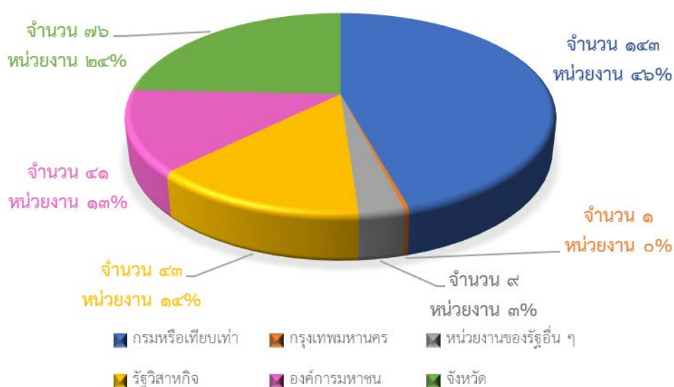
แผนภูมิที่ ๑.๑ จำแนกตามหน่วยงาน